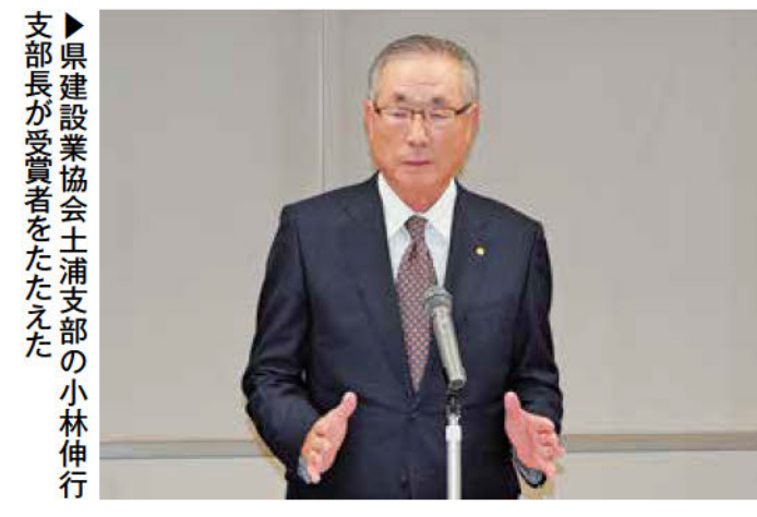
支部長が受賞者をたたえた