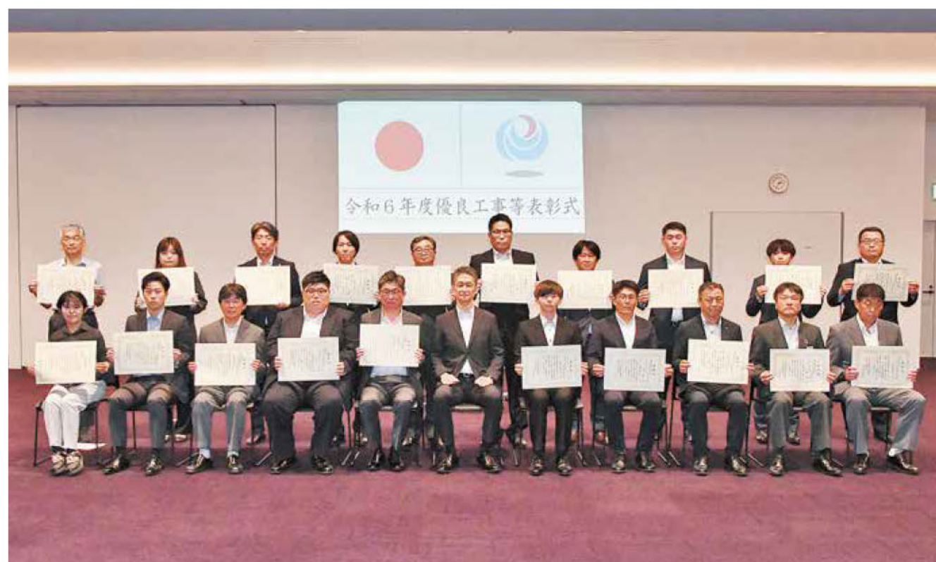
各事務所で表彰式が挙行された(写真は常陸河川国道事務所長表彰式の様子)

本社 〒300-2716 茨城県常総市大房27 電話 0297(42)1230代 FAX 0297(42)8294