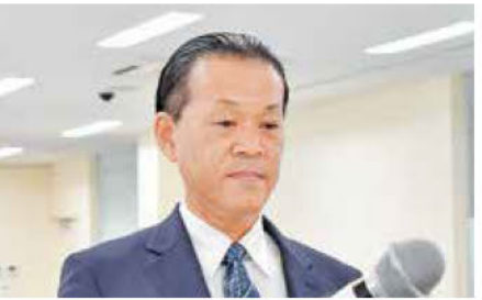
スペンサー工業(株)