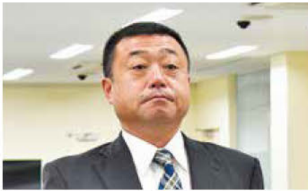
りんかい日産建設(株)