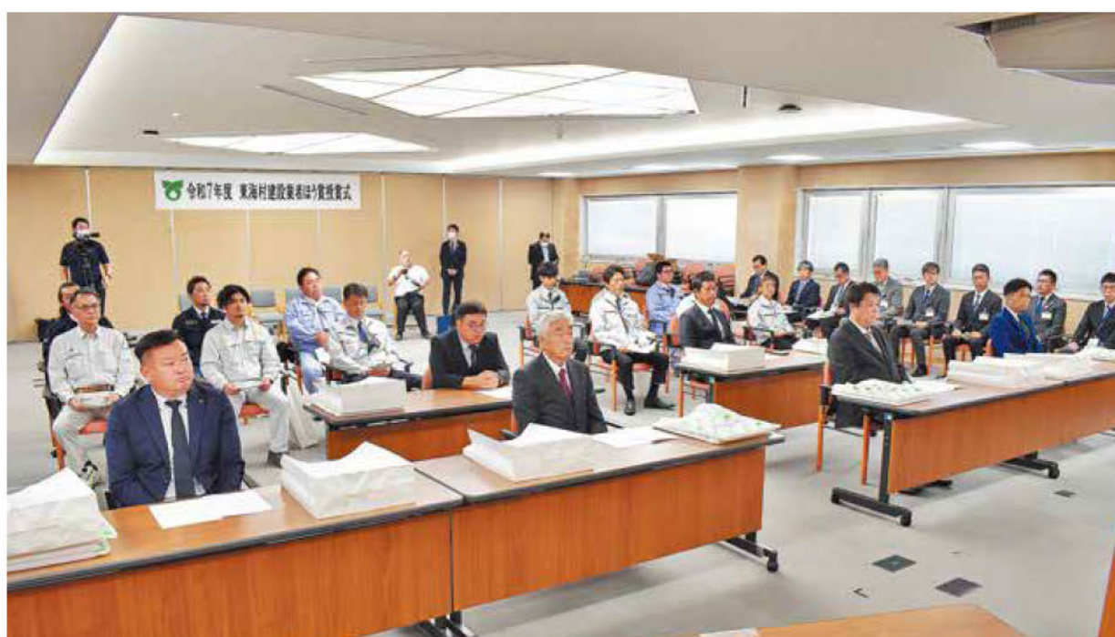
▲優秀施工の6社1JVと技術者が栄に浴した

東海村は1日、2025年度建設業者ほう賞授賞式を村役場庁舎2階多目的会議室で挙行了。本年度の受賞者は6社1JV。今回から優れた技術者、将来を嘱望される女性・若者技術者を被表彰者とする「東海村優秀技術者表彰」および「東海村女性・わかもの技術者表彰」を新たに設け、優秀技術者11人と技術者4人を表彰。功績をたたえ、山田修村長から表彰状と記念品が授与された。今回の表彰では、24年度内に完成した建設工事85件から、誠意をもって適正に施工し、優秀な成績で完成させた建設業者を選定した。