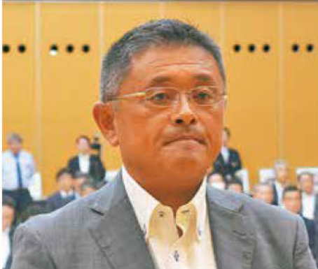
《知事表彰「DX賞」建設業者》 (株)川田建材工業