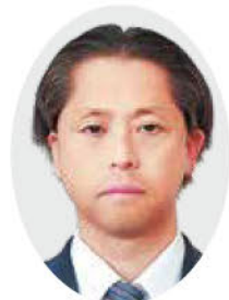
ごあいさつ 茨城県農林水産部長 三宅 建史

建設業の皆様方には、日頃より、土地改良事業、森林土木事業や漁港漁場整備事業など農林水産業の基盤づくりや災害復旧事業への迅速な対応、さらには、鳥インフルエンザなどの家畜疾病発生時の対応に御尽力を賜りまして厚くお礼申し上げます。