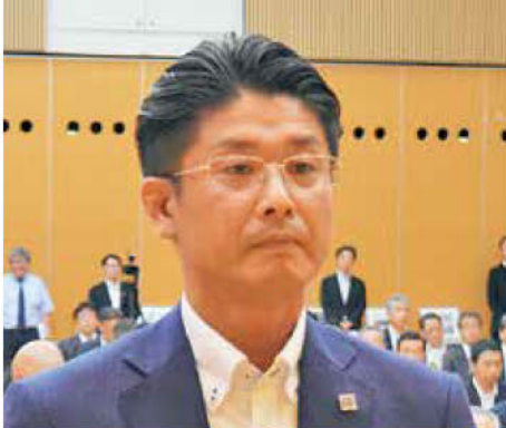
《知事表彰「DX賞」建設業者》 コスモ・大貫・大内JV