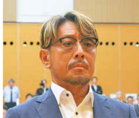
《知事表彰「DX賞」建設業者》 水郷建設(株)