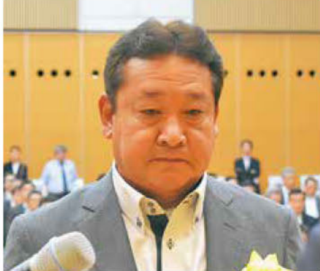
《知事表彰「DX賞」建設業者》 日高見建設工業(株)