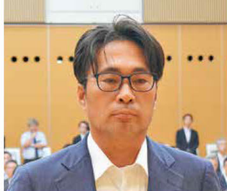
《知事表彰「DX賞」建設業者》 (株)井坂組