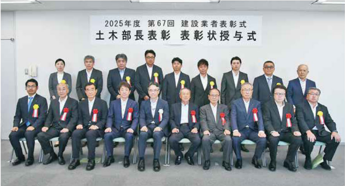
▲土木部長表彰受賞者