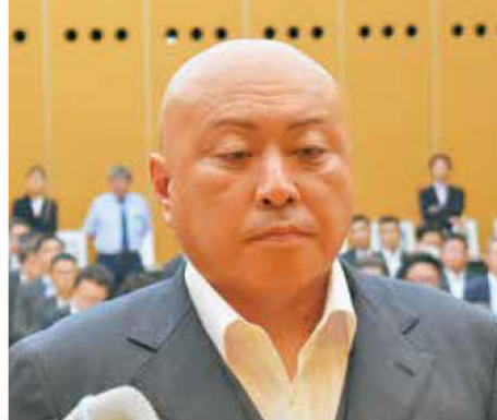
《知事表彰「DX賞」建設業者》 樋口土木(株)