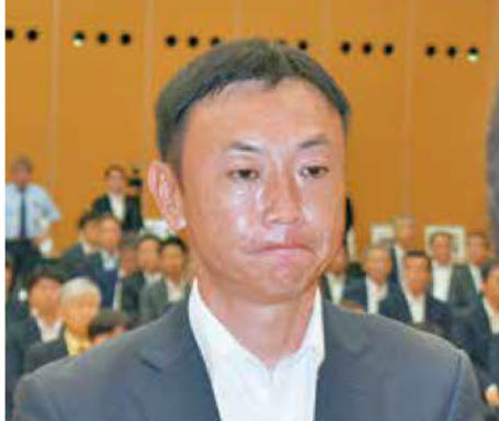
《知事表彰「DX賞」建設業者》 北都建設工業(株)