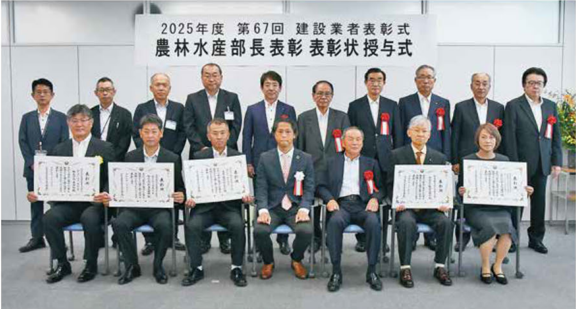
▲農林水産部長表彰受賞者