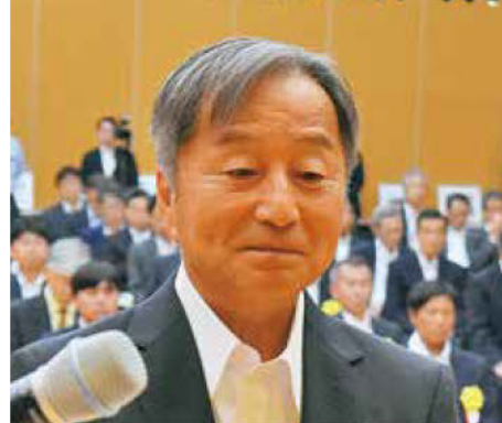
《知事表彰「DX賞」建設業者》 山川建設(株)