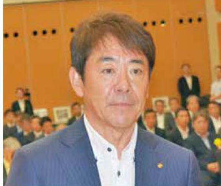
《知事表彰「DX賞」建設業者》 大昭建設(株)