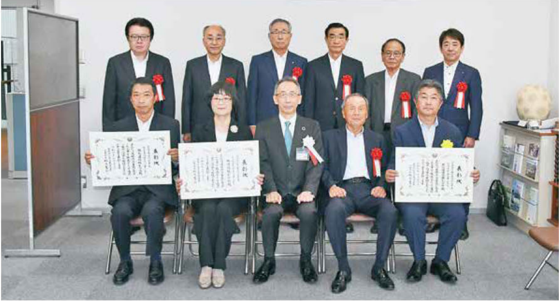
▲企業局長表彰受賞者