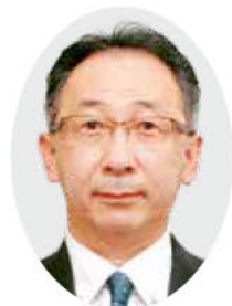
ごあいさつ 茨城県公営企業管理者 企業局長 稲見 真二