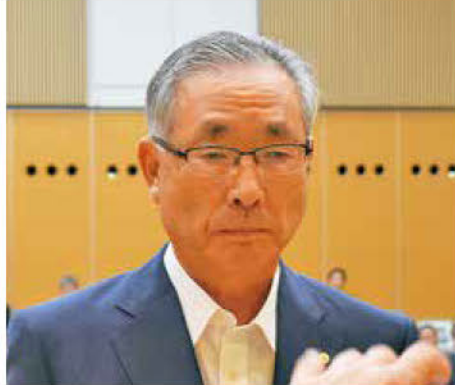
《知事表彰「DX賞」建設業者》 (株)新みらい