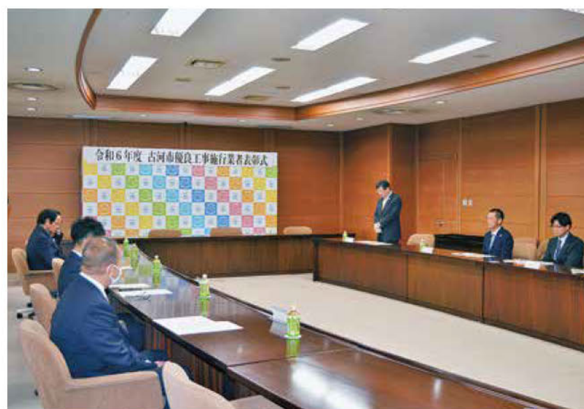
▲針谷市長が受賞者をたたえた