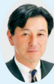
ごあいさつ 古河市長 針谷 力