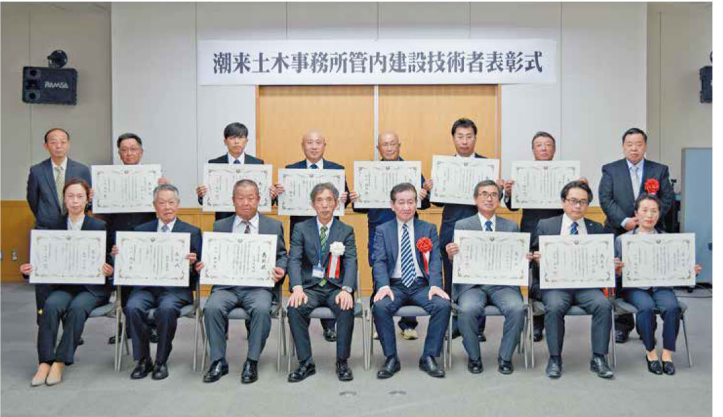
日時：令和5年12月6日(水) 場所：潮来土木事務所

令和5年度建設技術者表彰を受賞された皆様、誠におめでとうございます。また、建設業の皆様方には、地域の利便性や活性化を支える公共インフラの整備や、災害発生時の緊急対応等、多大なご協力をいただき、感謝申し上げます。さて、今回の表彰では、令和4年度に当事務所管内で完成した113件の工事の中から、特に成績優秀で他の模範となる12名の技術者を選定しました。皆様が日頃から励まれた技術研鑽の賜物であり、心より敬意を表します。受賞された皆様には、その優秀な技術を存分に発揮し、今後も公共工事の品質向上に努められることを期待しております。併せて、若手技術者の指導、育成をはじめ、建設業界の更なる発展に向けて、益々ご活躍されますことをご祈念申し上げます。