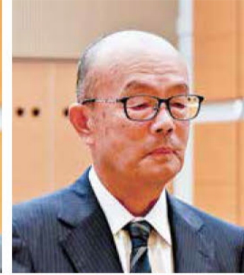
《知事表彰》 高橋建設(株)