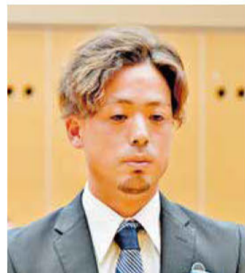
《知事特別賞表彰「DX賞」》 (株)潤沼建設工業