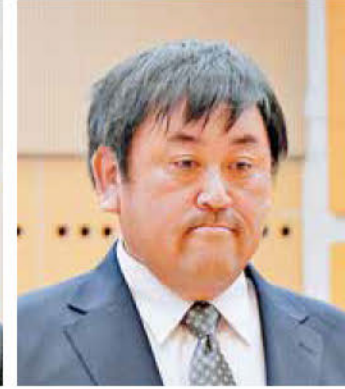
《知事表彰》鈴縫・千葉JV (株)千葉工務店