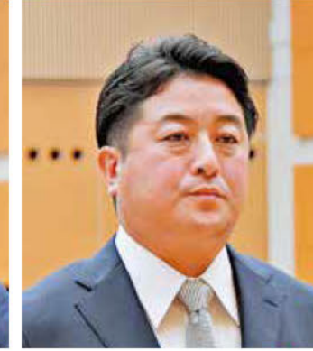
《知事表彰》 池田技建工業(株)