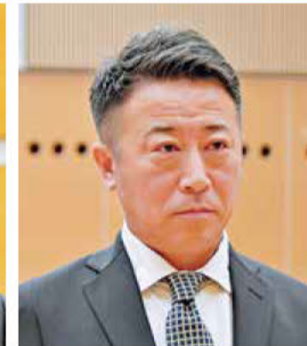
《知事特別賞表彰「DX賞」》 倉田建材(有)