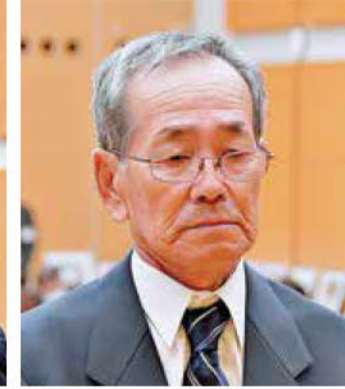
《知事表彰》 (株)田中工務店