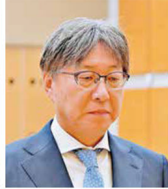
《知事表彰》 (株)小葉建設