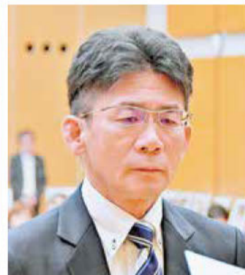
《知事特別賞表彰「DX賞」》 (株)金長設備工業