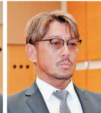
《知事特別賞表彰「DX賞」》 水郷建設(株)