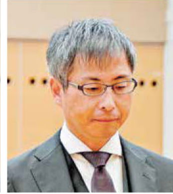
《知事表彰》鈴縫・千葉JV 鈴縫工業(株)