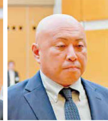
《知事表彰》 樋口土木(株)