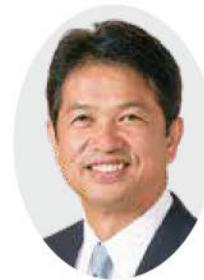
ごあいさつ 茨城県知事 大井川 和彦

県は10月31日、令和5年度～チャレンジいばらき～第65回建設業者表彰式を県庁舎9階講堂で挙行政。受賞者は知事賞10社、農林水産部長賞4社、土木部長賞12社、企業局長賞4社。知事表彰主任(監理)技術者の受賞者は5人。知事特別賞表彰の『DX賞』は5社が、『若手・女性技術者活躍賞』は主任(監理)技術者5人が受賞した。大井川和彦知事は受賞者を称えるとともに、「近年の頻発化・激甚化する自然災害から県民の命を守ることは喫緊の課題となっている。地元精通した皆さまが災害時には豊富な経験を発揮され、地域の守り手として活躍されていることに感謝申し上げます」と述べ、「今後も技術の研さんに励むとともに、働き方改革や生産性向上、担い手確保などの新たな取り組みに果敢にチャレンジし、業界全体のさらなる発展につなげていただきたい」と期待を寄せた。