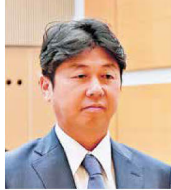
《知事表彰》 (株)郡司建設