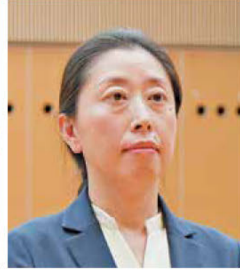
《知事表彰》株・菅原JV 菅原建設(株)