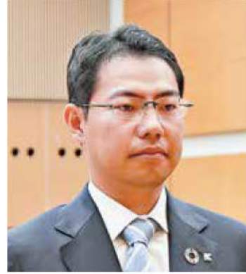
《知事表彰》株・菅原JV 株木建設(株)