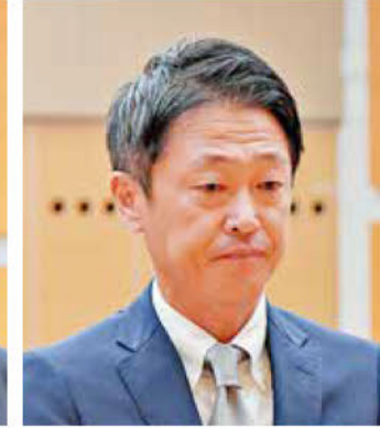
《知事表彰》 櫻井建設工業(株)