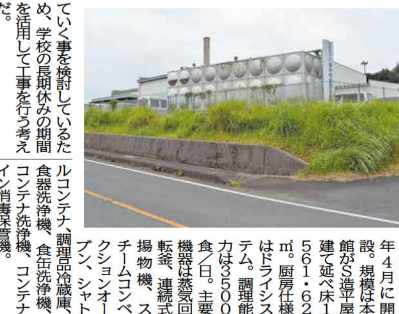
同施設は03年4月に開設。規模は本館がS造平屋建て延床1561.62㎡。厨房仕様はドラインシステム。調理能力は3500食/日。主要機器は蒸気回転式連続式揚物機、スチームコンベクションオーブン、シャトルコンテナ、調理品冷蔵庫、食器洗浄機、食缶洗浄機、コンテナ洗浄機、コンテナ消毒保管機。

石岡市は八郷学校給食センター(須釜1300㎡)の中規模改修工事を計画しており、本年度当初予算で3カ年継続費4億7050万円を設定している。機能を停止しないため、工区分割して複数年度で発注する。2023年度は1期工事を実施する予定で、10月ごろに一般競争入札を公告する。来年度は厨房設備などの2期工事を発注する見通しだ。設計は(株)オオエ総合設計が決定