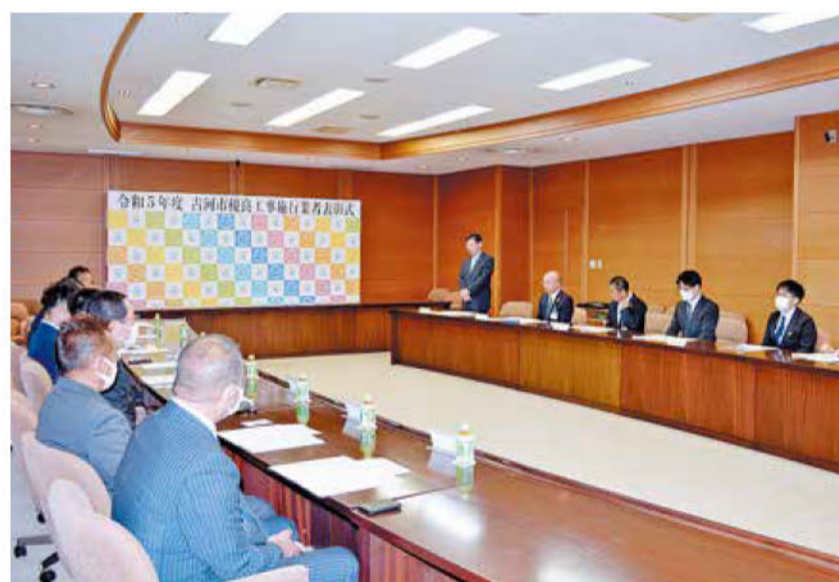
▲針谷市長が受賞者をたたえた