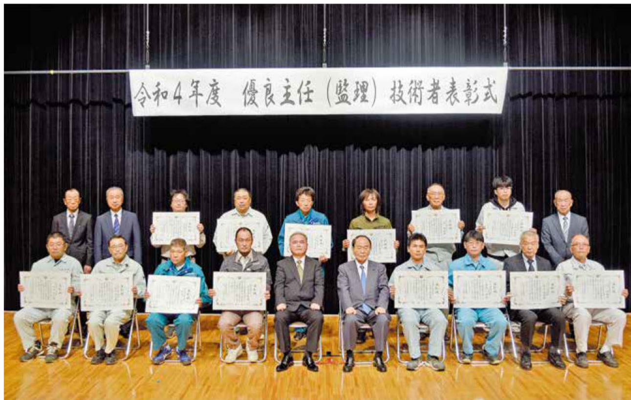
令和4年度 優良主任(監理)技術者表彰式

今後も新型コロナウイルス対策にも万全を期し、技術の研鑽に励まれるとともに、優れた模範技術者として後身の育成、また地域の公共土木施設の「守り手」として、建設業の発展に向けて益々活躍されますことをご期待申し上げます。